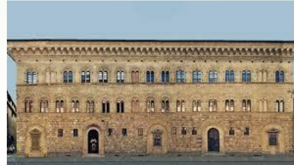
Palazzo Medici Riccardi